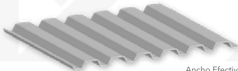
Ancho Efectivo 91.5 Peralte 38mm